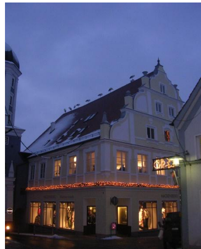
89331 Burgau Stadtstr. 3 Im Anschluss Krystalline

20. Juli Beginn: 19.00 Uhr Prosecco-Verkostung mit Astrid Spumante verkostet werden 5 Sorten Prosecco und 1 Sorte Champagner Brückenzoll 25 €