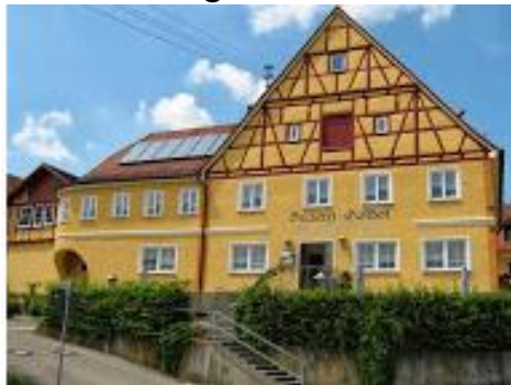
Brauereigasthof Zum Goldenen Engel Raiffeisenstraße 4 89367 Waldstetten Tel: 08223 1274