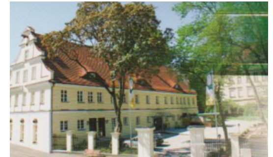
89335 Ichenhausen-Autenried Hopfengartenweg 2

10. Aug. Beginn: 17.15 Uhr Autenrieder Brauerei Gasthof Besichtigung Brauerei und Brauereimuseum Im Anschluss Krystalline im Restaurant